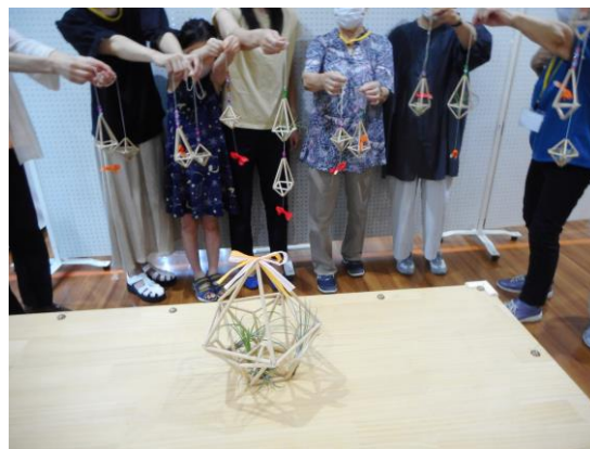
完成です！お部屋に飾るのが楽しみです。