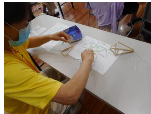
ヒンメリを2つ繋ぐのもおしゃれです。