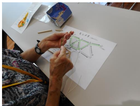
長さの違う紙ストローを繋げていきます。

令和4年8月5日 8名の方が参加して「やさしい手作り生活 ヒンメリ作り」講座を行いました。 フィンランドの伝統的なヒンメリを紙ストローで作ってみました。